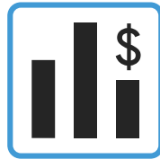
Auswertungs-/ Abrechnungs- Manager