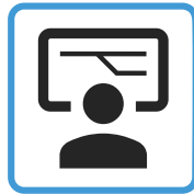
Operations Control Center