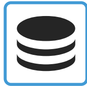
Datenbank und Schnittstellen